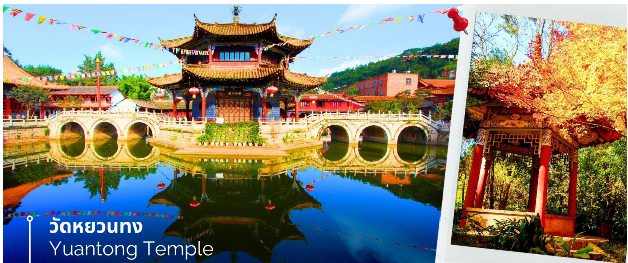
วัดหยวนตง Yuantong Temple

นำท่านชม วัดหยวนตง (Yuantong Temple) วัดแห่งนี้เป็นวัดที่ใหญ่และเก่าแก่ที่สุดในเมืองคุนหมิง สร้างมาตั้งแต่สมัยราชวงศ์ถัง มีอายุยาวนานประมาณ 1,200 กว่าปี การสร้างวัดแห่งนี้จะแปลกตกว่าวัดอื่นในจีน เพราะปกติแล้วการสร้างวัดของจีนส่วนมากจะต้องสร้างอยู่บนภูเขา แต่วัดหยวนตงสร้างวัดต่ำกว่าภูเขา โดยวิหารจะอยู่ต่ำที่สุด เนื่องจากวัดแห่งนี้ไม่ได้สร้างขึ้นเพื่อเป็นวัดโดยตรง แต่เคยเป็นศาลเจ้าแม่กวนอิมมาก่อน