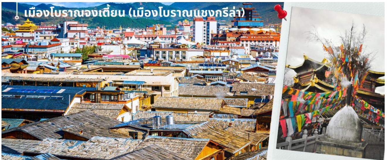
เมืองโบราณจงเตี้ยน (เมืองโบราณแซงกรีล่า)

นำท่านเดินทางสู่ เมืองจงเตี้ยน (แซงกรีล่า) (ใช้เวลาเดินทางประมาณ 5 ชั่วโมง) ซึ่งอยู่ทางทิศตะวันออกเฉียงเหนือของมณฑลยูนนานซึ่งมีพรมแดนติดกับอาณาเขตนำซีของเมืองลี่เจียงและอาณาจักรหยี่ของ