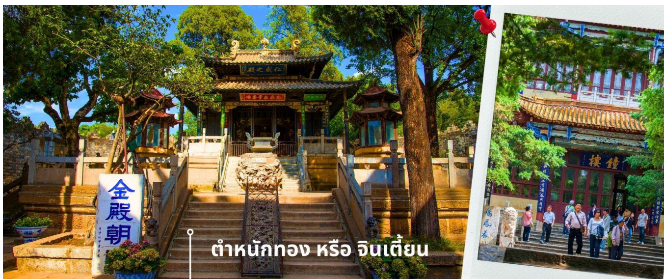
ดำหนักทอง หรือ จินเตียน

เช้า รับประทานอาหารเช้า ณ ห้องอาหารโรงแรม (1) นำท่านเยี่ยมชม ดำหนักทอง หรือ จินเตียน (The Golden Temple Park | Jindian park) (ไม่รวมค่ารถแบตเตอร์รี่ 10 หยวน/ท่าน) โบราณสถานสำคัญของมณฑลยูนนาน ที่ได้รับการปกป้องดูแลโดยรัฐบาลจีน ตั้งอยู่บริเวณเชิงเขาหมิงเฟิง ล้อมรอบด้วยแนวกำแพงและหอคอยเหมือนเป็นป้อมปราการ ดำหนักทองถูกเรียกตามลักษณะอาคารที่มีสีทองอร่าม จากทองเหลืองในส่วนของผนังและหลังคา รวมกว่า 200 ตัน โดยถือเป็นสิ่งปลูกสร้างสัมฤทธิ์ที่ใหญ่ที่สุดของจีน ภายในมีรูปปั้นทองโดยมีเงินอยู่ (เสวียนอยู่) เทพเจ้าลัทธิเต๋าเป็นองค์ประธาน