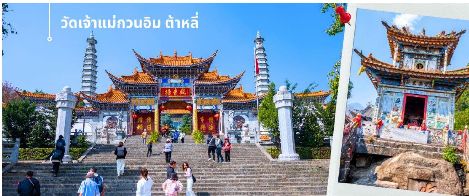
วัดเจ้าแม่กวนอิม ต้าหลี่

นำท่านชม วัดเจ้าแม่กวนอิม (ใช้เวลาเดินทาง 30 นาที) ตามตำนานเล่าว่าเจ้าแม่กวนอิมได้แปลงกายเป็นหญิงชราแบกก้อนหินใหญ่ไว้บนหลังเพื่อให้ทหารของฝ่ายตรงข้ามได้เห็นเมื่อทหารฝ่ายศัตรูได้เห็นแม่แต่หญิงชรายังแข็งแรงถึงเพียงนี้ ถ้าเป็นคนวัยหนุ่มสาวจะต้องมีพลังกำลังมากมายยากที่จะต่อสู้อ จึงทำให้ไม่ทำการเข้าโจมตีเมืองและถอยทัพกลับไป ชาวเมืองจึงสร้างวัดแห่งนี้ขึ้นในสมัยราชวงศ์ถัง ซึ่งถือว่าเป็นวัดที่มีประติมากรรมยอดเยี่ยมแห่งหนึ่งในต้าหลี่