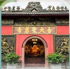
วัดโบราณต้าฉือ

✈️ คอนเฟิร์มออกเดินทาง ทุกปีเร็ว 2 วันขึ้นไป