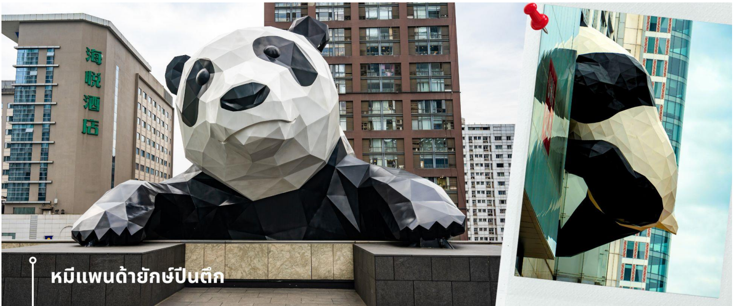
หมีแพนด้ายักษ์ป็นติก

จากนั้นนำท่านชมความน่ารัก อันเป็นเอกลักษณ์ของมหานครเฉิงตู นั่นคือ หมีแพนด้ายักษ์ป็นติก ประติมากรรมที่ชื่อว่า "I Am Here" ซึ่งเป็นหมีแพนด้ายักษ์ที่ตั้งอยู่ที่ IFS (International Finance Square) ในเมืองเฉิงตู ประติมากรรมนี้มี