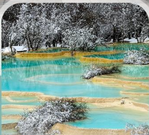
อุทยานแห่งชาติหวงหลง (บริการรถเช่าขึ้นลง+รถแบคเตอร์)