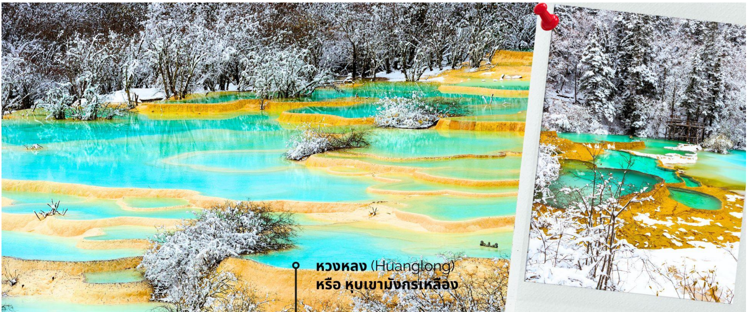
หวงหลง (Huanglong) หรือ หุบเขามังกรเหลือง

หวงหลง (Huanglong) หรือ หุบเขามังกรเหลือง (รวมค่ากระเช้าขึ้น-ลง หวงหลงและรถแบคเตอร์) ที่ได้รับการขึ้นทะเบียนเป็นมรดกโลก รายล้อมไปด้วยแอ่งน้ำสีฟ้าจำนวนนับไม่ถ้วน และภูเขาสูงใหญ่สลับซับซ้อน อุทยานหวงหลง (Huanglong Scenic and Historic Interest Area) หรือ หุบเขามังกรเหลือง แหล่งธรรมชาติที่อุดมสมบูรณ์บนเทือกเขา Minshan Mountains มีระบบนิเวศที่หลากหลาย ทั้งน้ำพุร้อน น้ำตก แอ่งน้ำหินปูน รวมถึงเป็นแหล่งของพืชพรรณนานาชนิด และสัตว์ป่าใกล้สูญพันธุ์อย่าง แพนด้ายักษ์ และ ลิงจุกเขดสีทอง เป็นต้น ที่สำคัญยังมีทัศนียภาพที่สวยงามที่รารวกับเป็นดินแดนสวรรค์ ด้วยคุณสมบัติเหล่านี้ อุทยานหวงหลงจึงได้รับการขึ้นทะเบียนเป็นมรดกโลกโดย