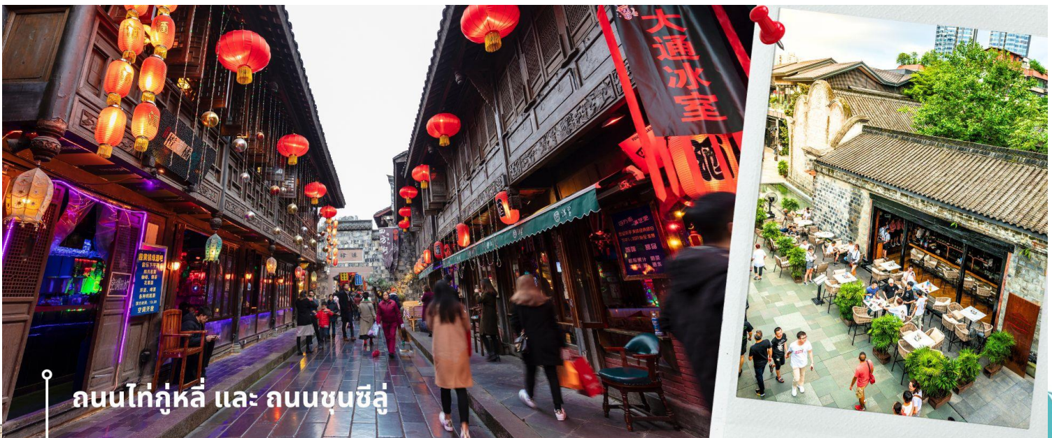
ถนนไถ่กุหลี่ และ ถนนชุนซี้ลู่

จากนั้นให้ท่านให้อิสระกับการเลือกซื้อสินค้าของฝากที่ ถนนไถ่กุหลี่ และ ถนนชุนซี้ลู่ ในย่านนี้เป็นถนนโบราณ ในอดีตเคยโรงงานผลิตผ้าไหมใหญ่ที่สุดในจีน ปัจจุบันได้เปลี่ยนเป็นถนนช้อปปิ้งแหล่งสวรรค์ของนักท่องเที่ยว เป็นถนนคนเดิน มีห้างสรรพสินค้าชื่อดัง มีร้านค้ามากกว่า 700 ร้านค้าที่เต็มไปด้วยสินค้าต่าง ๆ ทั้งร้านค้าแฟชั่น ร้านอาหารและโรงแรม