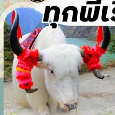
ทะเลสาบเต๋อซี