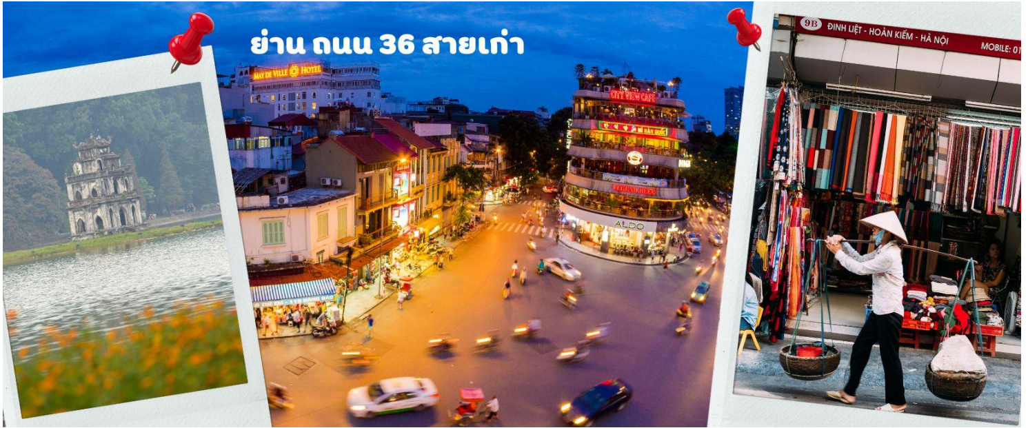
ย่าน ถนน 36 สายเก่า

จากนั้นให้ท่านได้ อิสระช้อปปิ้ง ถนนสาย 36 street แหล่งช้อปปิ้งของฮานอย มีต้นไม้ปกคลุมสองฝั่งถนน สาเหตุที่ชื่อถนน 36 มาจาก 36 อาชีพที่ทำการค้าขายบนถนนแห่งนี้ ตั้งแต่อดีตอย่างงานด้านหัตถกรรมสอดคล้องกับชื่อถนนแต่ละเส้น ในอดีตอย่าง เครื่องเงิน ผ้าไหม บนถนนแห่งนี้ แต่ปัจจุบันมากกว่า 36 ไปแล้ว ที่นี่จะเป็นแหล่ง Shopping มีสินค้าเกือบทุกชนิด ร้านขายชุดกีฬาทุกแบรนด์เพราะที่นี่เป็นแหล่งผลิตให้หลาย ๆ แบรนด์