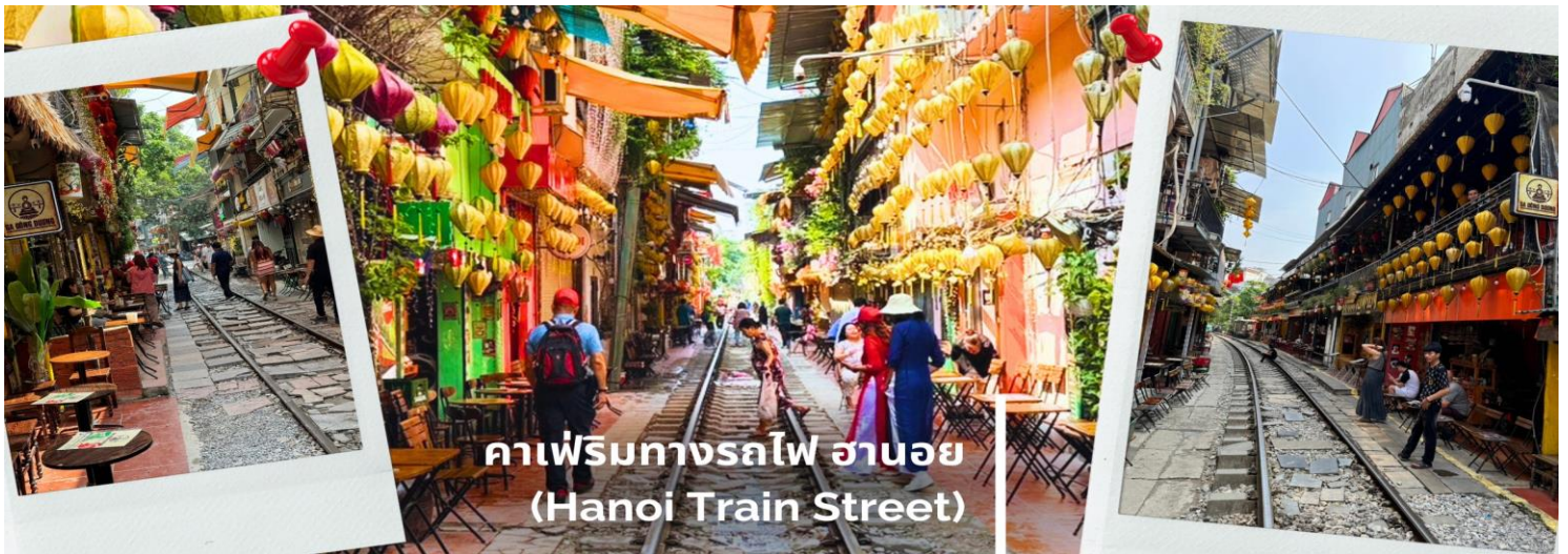
คาเฟ่ริมทางรถไฟ ฮานอย (Hanoi Train Street)