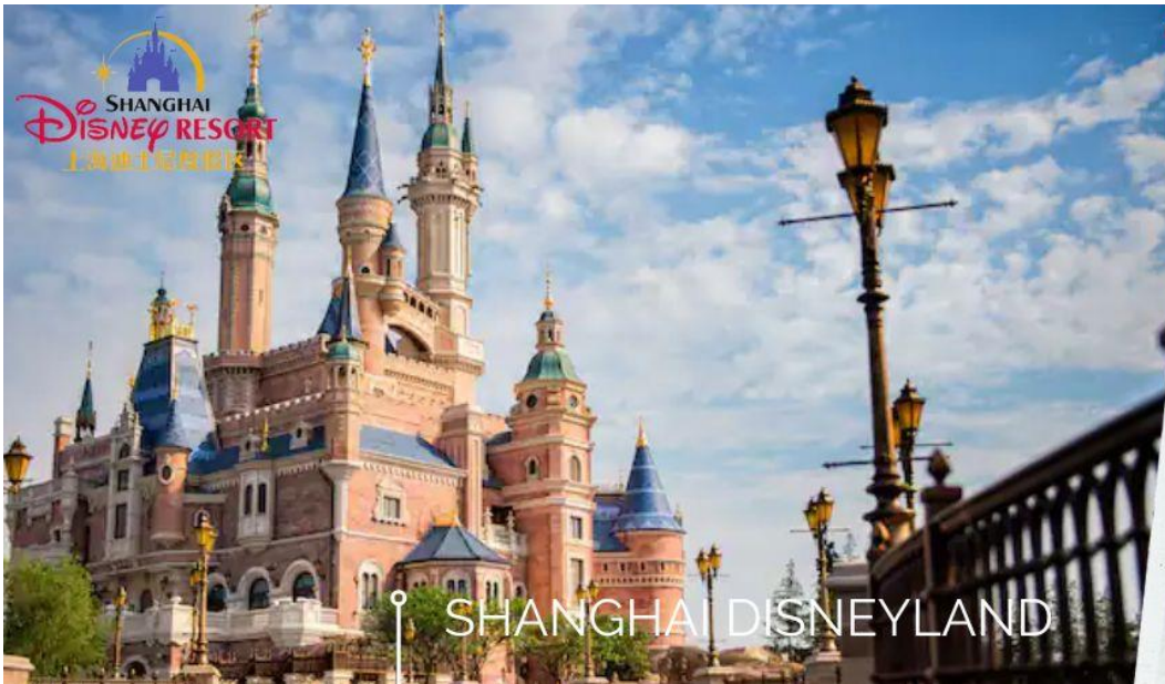
📍 SHANGHAI DISNEYLAND

เช้า ๑๐ รับประทานอาหารเช้า ณ ห้องอาหารโรงแรม (3) นำท่านเข้าสู่ดินแดนแห่งความฝัน SHANGHAI DISNEYLAND เซี่ยงไฮ้ดิสนีย์แลนด์ แห่งนี้เป็นสวนสนุกแห่งที่ 6 ของดิสนีย์แลนด์ทั่วโลก มีขนาดใหญ่อันดับ 2 ของโลก รองจากดิสนีย์แลนด์ในออร์แลนโด รัฐฟลอริดา สหรัฐฯ และเป็นสวนสนุกดิสนีย์