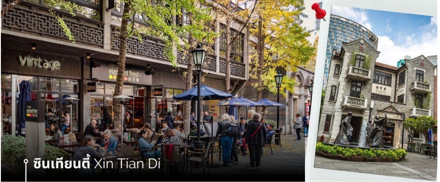
ซินเทียนตี้ Xin Tian Di

นำท่านเที่ยวชม ซินเทียนตี้ ย่านฮิปเตอร์ใจกลางนครเซี่ยงไฮ้ ที่วัยรุ่นต้องมา กลายเป็นสถานที่ท่องเที่ยวติดอันดับต้นๆไปแล้ว สำหรับแหล่งช้อปปิ้งแห่งนี้ ไม่แพ้แหล่งช้อปปิ้งรุ่นพี่อย่าง ถนนนานกิง ถนนอยู่เจียง Yu Yuan Bazaar ถือว่าเป็นอีก 1 ไฮไลท์เด็ดของนครแห่งนี้ เนื่องจากเอกลักษณ์ที่ไม่เหมือนใคร สิ่งปลูกสร้างที่ใช้อิฐบล็อกแบบสถาปัตยกรรมแบบ Shikumen (ซิกเหมิน) การผสมผสานระหว่างสถาปัตยกรรมตะวันตกกับจีนเข้าด้วยกัน ทางเดินหิน กำแพงหิน ประติมากรรม บ้านเมืองเก่าแต่ดูแลรักษาอย่างดี