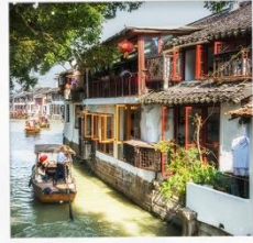
เมืองโบราณซูเจียเจีย