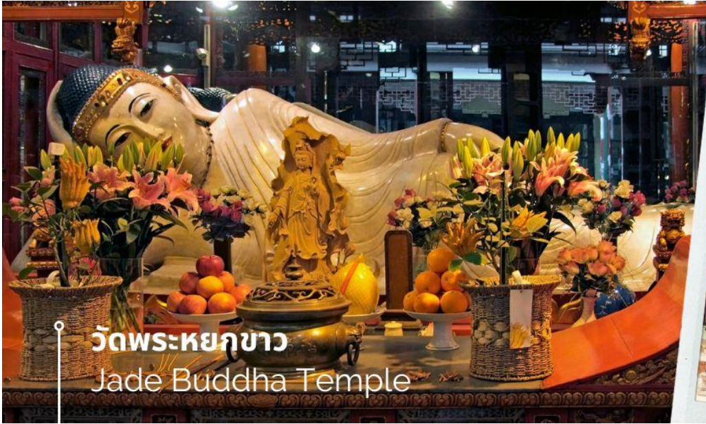
วัดพระหยกขาว Jade Buddha Temple

นำท่านชม วัดพระหยกขาว Jade Buddha Temple เป็นวัดที่มีชื่อเสียงมากที่สุดในเมืองเซี่ยงไฮ้ ซึ่งเป็นที่รู้จักจากพระพุทธรูปสององค์ที่สร้างขึ้นจากหยกทั้งแท่ง องค์พระพุทธรูปปางนั่งมีความสูง 190 เซนติเมตร และ หุ้มด้วยเพชรพลอย หิน มอโนรา และ มรกต และองค์พระพุทธรูปปางไสยาสน์ มีความยาว 96 เซนติเมตร นอนเอียงด้านขวาและหนุนพระเศียรด้วยพระหัตถ์ขวา ถือเป็นวัดที่มีทั้งชาวจีนและนักท่องเที่ยวเดินทางมาสักการะบูชาตลอดทั้งวัน