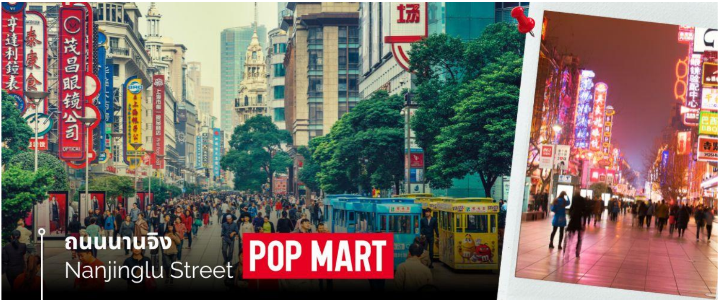
ถนนนานจิง Nanjinglu Street POP MART

และนำท่านช้อปปิ้งย่าน ถนนนานจิง Nanjinglu Street ศูนย์กลางสำหรับการช้อปปิ้งที่คึกคักมากที่สุดของนครเซี่ยงไฮ้ รวมทั้งห้างสรรพสินค้าใหญ่ชื่อดังกว่า 10 ห้าง และช้อปปิ้ง ร้าน POP MART สุดฮิตในขณะนี้เพื่อเป็นของฝากที่ระลึกให้แก่ญาติสนิทมิตรสหาย