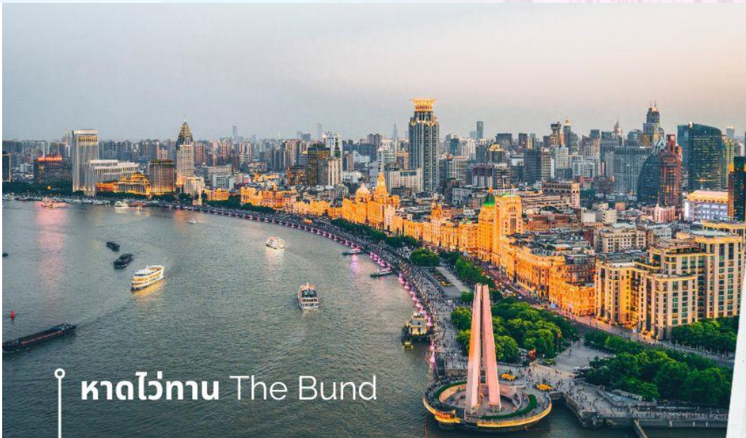
📍 หาดวอทัน The Bund