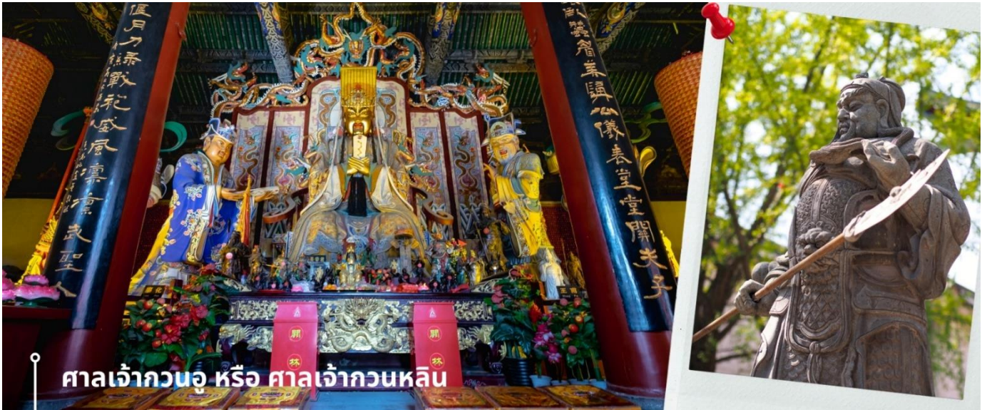
ศาลเจ้ากวนอู หรือ ศาลเจ้ากวนทลิน

ปัจจุบันถ้ำแห่งนี้ได้รับการขึ้นทะเบียนเป็นมรดกโลกทางด้านวัฒนธรรมโดยองค์การยูเนสโก และได้รับการยอมรับให้เป็นพิพิธภัณฑสถานขนาดใหญ่ นำท่านเดินทางไปยัง ศาลเจ้ากวนอู หรือ ศาลเจ้ากวนทลิน ในเมืองลั่วหยาง ตั้งอยู่ทางใต้ของเมืองลั่วหยาง มีประวัติศาสตร์กล่าวว่าที่นี่เป็นสถานที่ฝังศีรษะของแม่ทัพกวนอู ผู้จงรักภักดีในสมัยพระเจ้าฮั่นเทียนเต๋อ ก่อนถึงตำแหน่งที่ประดิษฐานเทพเจ้ากวนอู จะมีแนวต้นไม้และสิ่งโตหินจำนวน 104 ตัว ตั้งเรียงรายอยู่สองข้างทางเดิน พร้อมผ้าสีแดงสดเขียนคำอวยพรผูกอยู่กับตัวสิ่งโต รวมถึงยังมีแผ่นกระดาษให้เขียนขอพรและนำไปแขวนไว้ตามกิ่งไม้