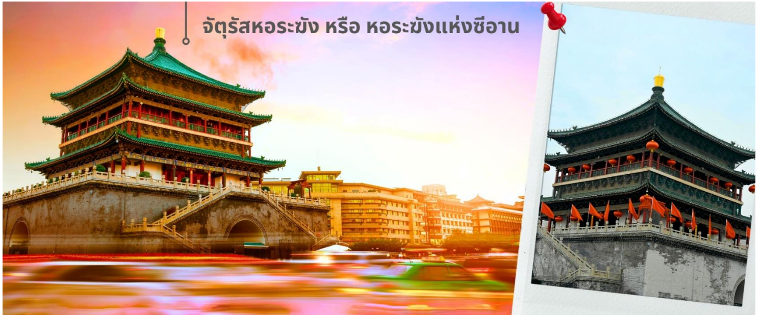
จัตุรัสหอระฆัง หรือ หอระฆังแห่งซีอาน

จากนั้นนำท่านเดินทางเที่ยวชม จัตุรัสหอระฆัง หรือ หอระฆังแห่งซีอาน เป็นหนึ่งในสัญลักษณ์สำคัญของเมืองซีอาน ตั้งอยู่ใจกลางเมือง สร้างขึ้นในปี ค.ศ. 1384 สมัยราชวงศ์หมิง เพื่อใช้ประกาศเวลาและเตือนภัยจากศัตรู ตัวหอสร้างจากไม้ทั้งหลัง มีความสูงประมาณ 36 เมตร โดดเด่นด้วยสถาปัตยกรรมจีนโบราณที่งดงาม และการประดับด้วยลวดลายสีทอง