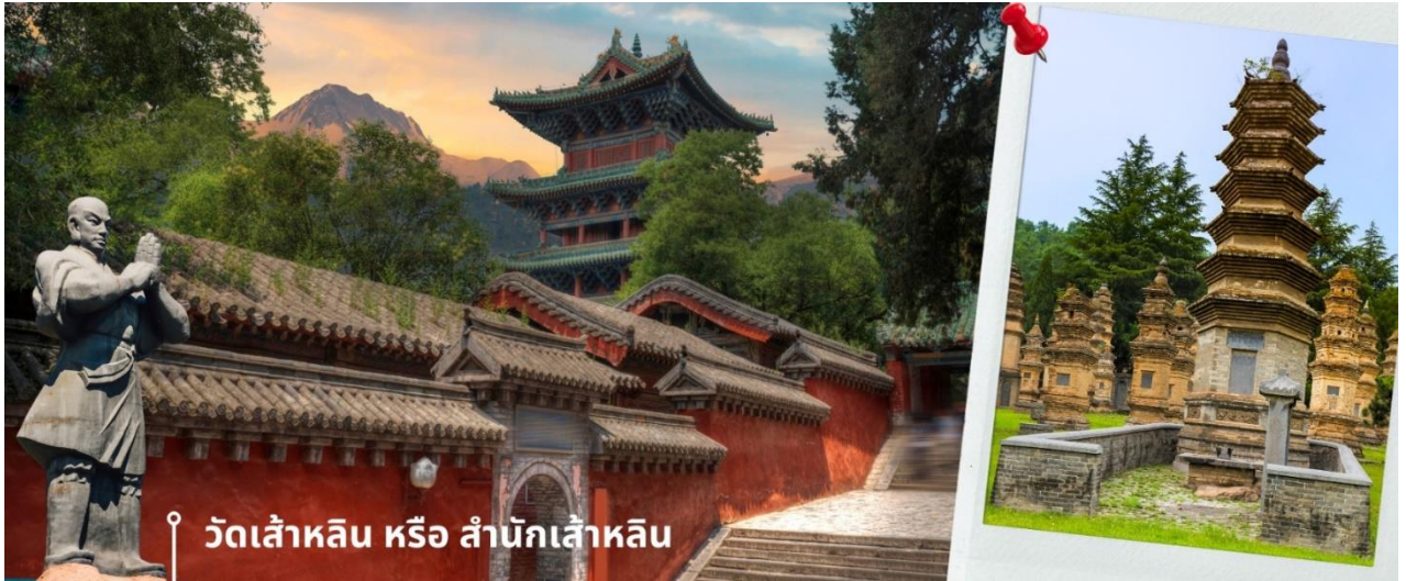
วัดเส้าหลิน หรือ สำนักเส้าหลิน

ของนักแสดง ซึ่งทุกคนล้วนถูกฝึกปรืออย่างหนัก กว่าที่จะออกมาเป็นโชว์สุดยอดเยี่ยม จนถึงขั้นที่ว่ากังฟูของสำนักเส้าหลิน