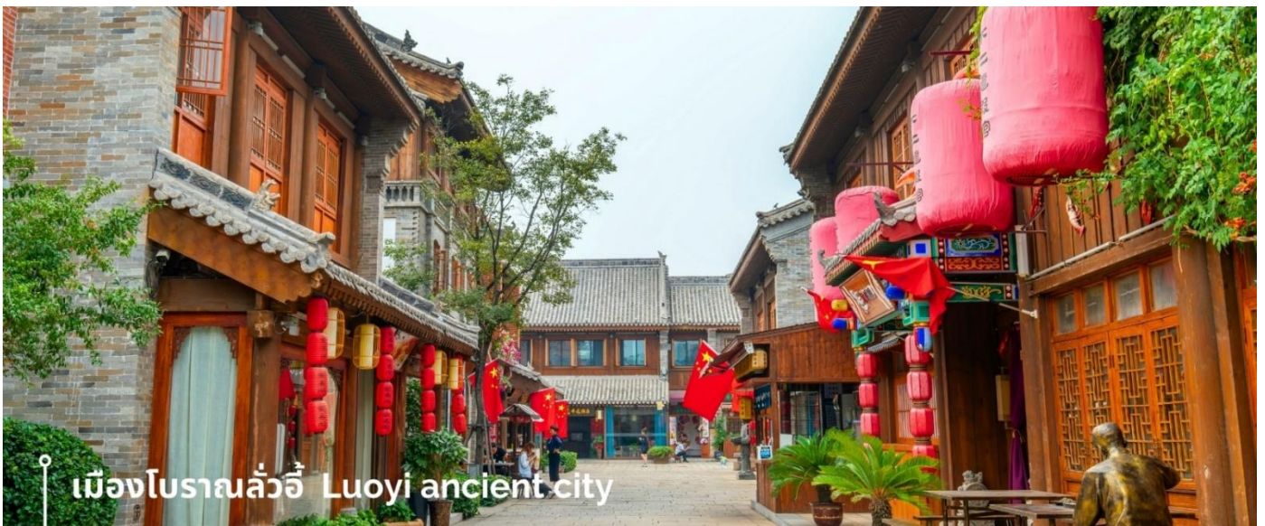
เมืองโบราณลั่วอี้ Luoyi ancient city