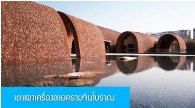
เตาเผาเครื่องลายครามจีนโบราณ