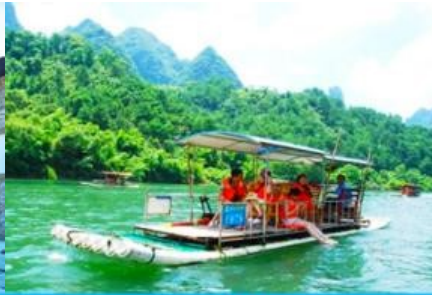
ล่องแพไม้ไผ่