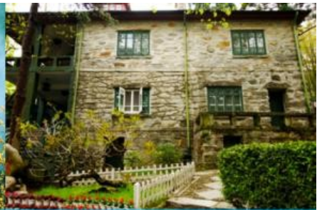
เรือนรับรอง หม่ยหลู

นำท่านเที่ยวชม อุทยานธรรมชาติเขาลูซาน (รวมค่ารถบัสรับส่งภายในอุทยาน) นำท่านชม สวนฮวาจิ้ง 花径公园 เป็นสวนดอกท้อที่ขึ้นชื่อภายในเขตอุทยาน ตั้งอยู่ริมทะเลสาบหลูจิน เล่ากันว่าเป็นที่ซึ่งกวีชื่อดังสมัย