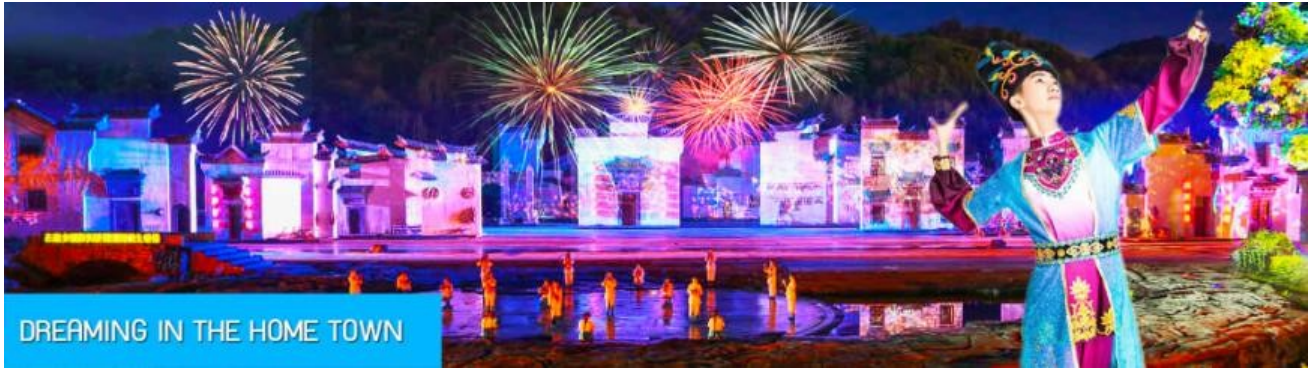
DREAMING IN THE HOME TOWN

หลังอาหารนำท่านเดินทางเข้าที่พัก หรือท่านสามารถเลือกซื้อโปรแกรมเสริม เป็นบัตรชมการแสดง ชุด DREAMING IN THE HOME TOWN เป็นการแสดงบนเวทีขนาดใหญ่ที่จัดสร้างขึ้นกลางแจ้ง ท่ามกลางธรรมชาติที่มีภูเขาเป็นฉากหลัง ใช้ทุนสร้างกว่า 280 ล้านบาท เป็นการแสดงที่น่าดูชมที่สุดในมณฑลเจียงซี แต่ละฉากการแสดงมีการออกแบบเวที ฉากประกอบที่พิถีพิถัน ประณีต และอลังการ ใช้ทีมงานนักแสดงหลายร้อยคน และระบบแสง สี เสียงที่ทันสมัยประกอบในการแสดง