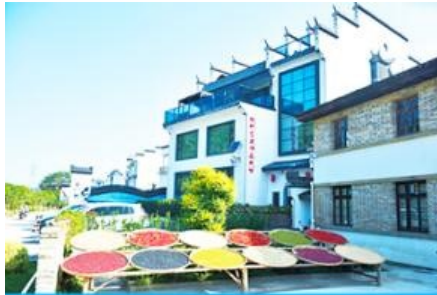
หมู่บ้านโบราณ สือหมินซุน