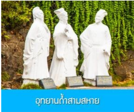
อุทยานสามสหาย