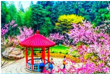
สวนฮวาจิ้ง