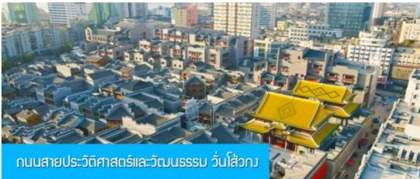
ถนนสายประวัติศาสตร์และวัฒนธรรม วันไ่สวัก

พักที่ โรงแรม JIANGNAN HAOTING HOTEL ระดับ 4 ดาวท้องถิ่นหรือเทียบเท่าในเมืองซ่งเหรา