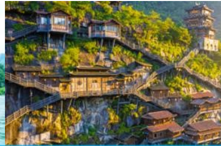
อุทยาน วังเซียนกู่

วันที่สี่ เมืองวู่หยวน-หมู่บ้านโบราณเหยียนสือหมินซุน-ล่องแพไม้ไผ่ - เมืองซังเหลา - หุบเขาเทวดาวังเซียนกู่