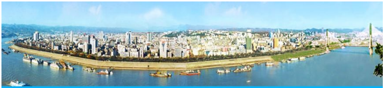
เมืองหยีซัง