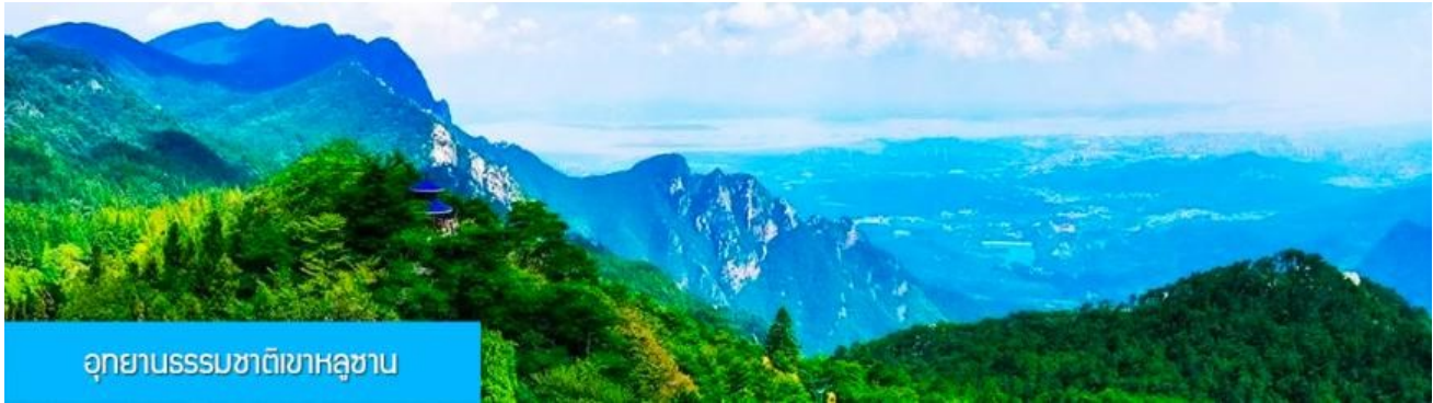
อุทยานธรรมชาติเขาลูซาน