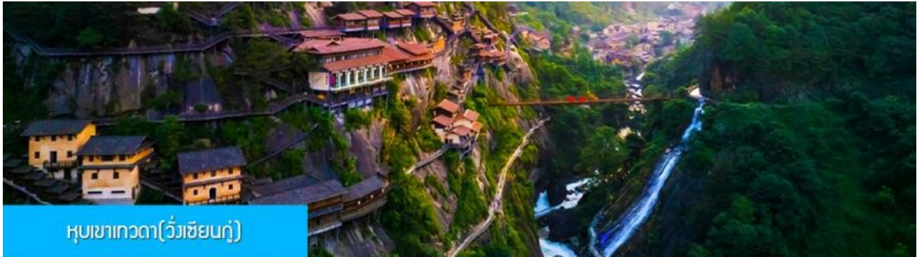
หุบเขาเกวต๋า(วังเซียนกู่)