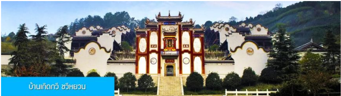
บ้านเกิดกวี ชวีหยวน