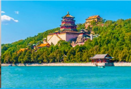
พระราชวังฤดูร้อนหยี่เหอหยวน