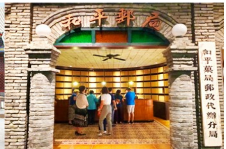
เมืองโบราณจำลอง