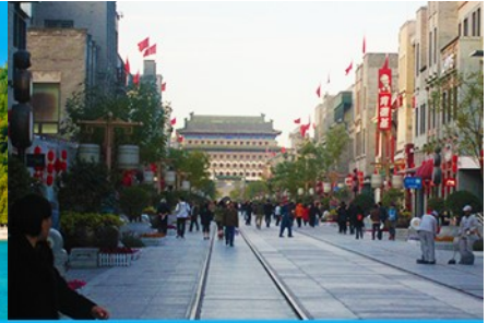
ถนนเจียนเหมิน

วันที่สี่ หอฟ้าเทียนถาน-ศูนย์แพทย์แผนจีน -พระราชวังฤดูร้อน - ถนนโบราณเจียนเหมินต้าเจีย- เดินทางกลับกรุงเทพฯ