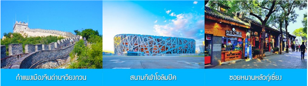
กำแพงเมืองจีนด่านวิยงกวน

ค่า รับประทานอาหารกลางวัน ณ ภัตตาคาร พักที่ JINGLIN HTL OR HOLIDAY INN EXPRESS HTL 4* หรือ โรงแรมในระดับเดียวกันในกรุงปักกิ่ง