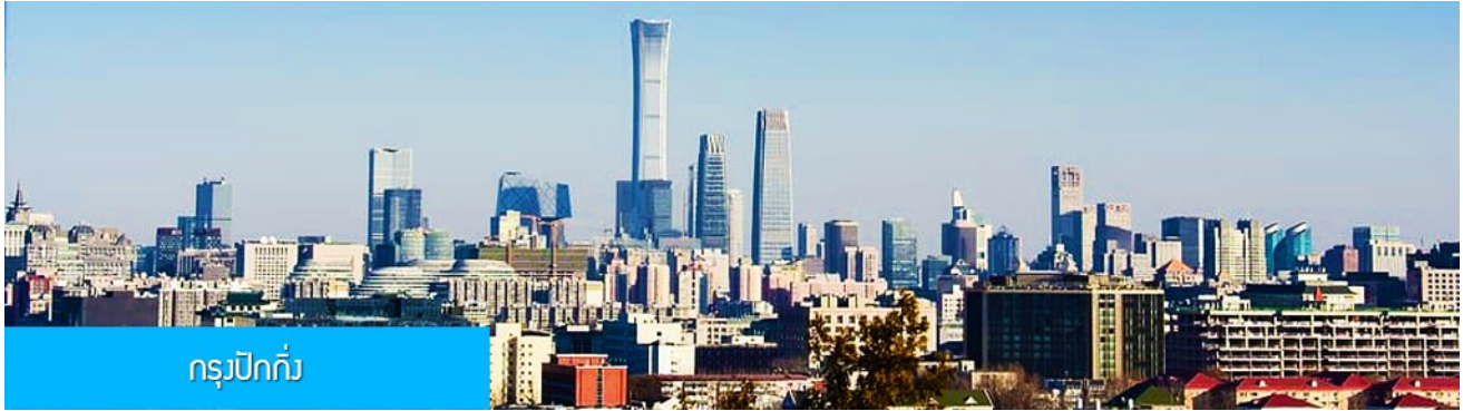
กรุงปักกิ่ง