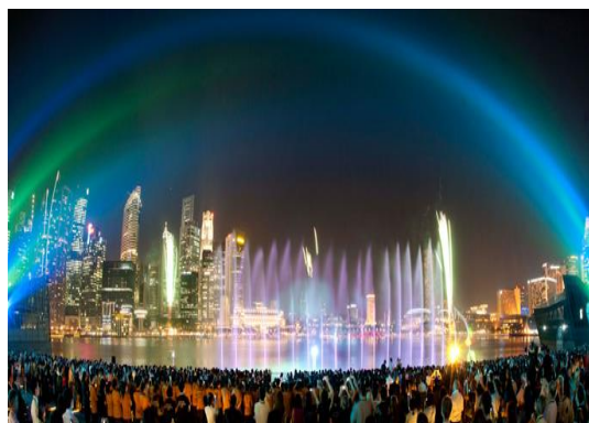
หันหน้าออกทางอ่าว Marina

จากนั้นเดินทางเข้าเยี่ยมชมมารีน่าเบย์แชนด์ Marina Bay Sand โรงแรมหรูระดับ 6 ดาว โดยพื้นที่ด้านในประกอบไปด้วยโรงแรมห้างสรรพสินค้า จุดชมวิว พิพิธภัณฑท์ คาสิโน และโรงภาพยนตร์ รวมถึงส่วนของ แชนด์สกายพาร์ค ที่เป็นสระว่ายน้ำ(ไม่รวมค่าเข้าชม จุดชมวิว SAND SKY PARK57 ราคา 30 SGD หรือประมาณ 810 บาท)