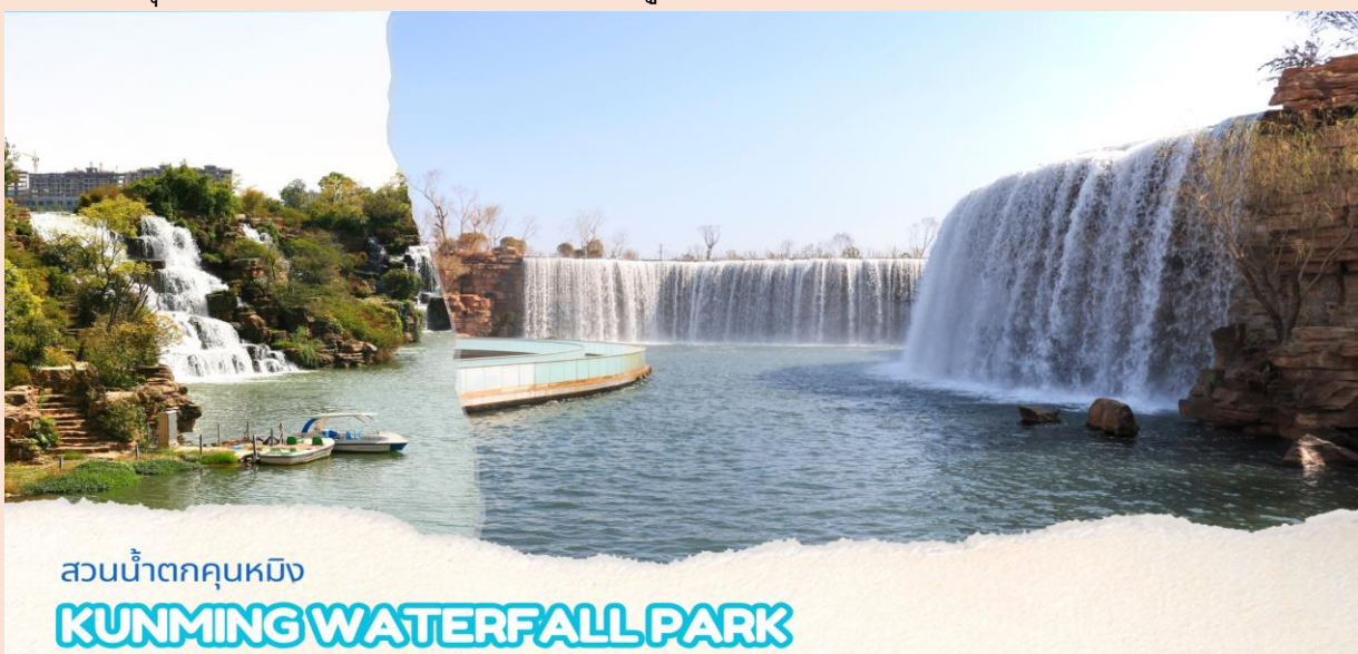
สวนน้ำตกคุนหมิง KUNMING WATERFALL PARK