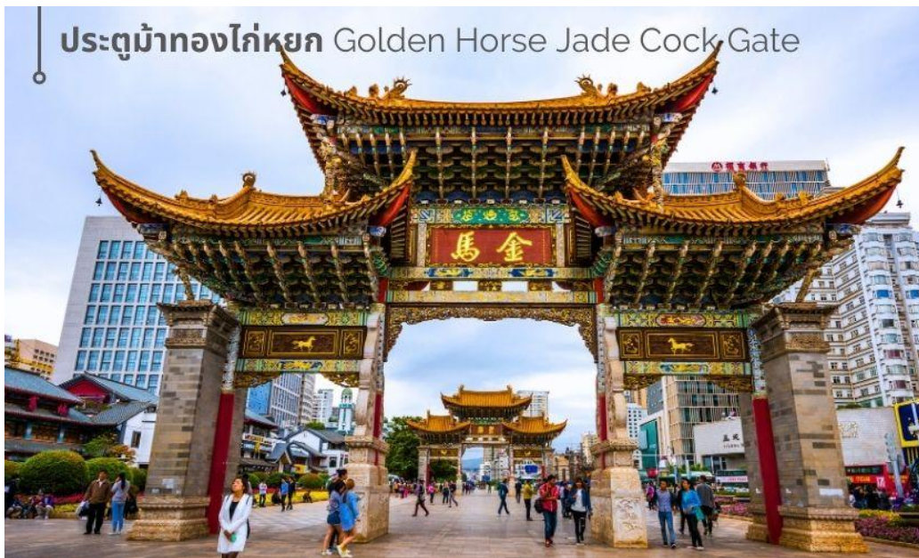
ประตูม้าทองไก่อหยก Golden Horse Jade Cock Gate

ชม ชุ่มประตูม้าทอง และ ชุ่มประตูไก่อหยก ซึ่งภาษาจีนเรียกว่าจินหม่า และปี้จี้ จิงเอาคำย่อ จินปี้ มาชานานนามถนนแห่งนี้ ชุ่มม้าทองและไก่อหยก มีอายุร่วม 400 ปี สร้างขึ้นในสมัยราชวงศ์หมิง ในถนนย่านการค้าแห่งนี้ เป็นแหล่งเสื้อผ้าแบรนด์เนมทั้งของจีนและต่างประเทศ รวมทั้งเครื่องประดับ อัญมณี ร้านเครื่องดื่ม และร้านขายของที่ระลึกมากมาย