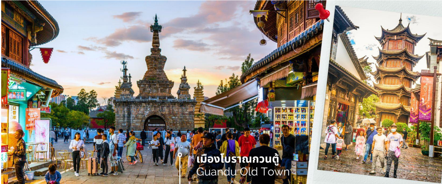
เมืองโบราณกวนตุ๋ Guandu Old Town

นำท่านชมบรรยากาศ เมืองโบราณกวนตุ๋ (Guandu Old Town) เป็นหนึ่งในต้นกำเนิดของวัฒนธรรมยูนนาน และยังถือเป็นหนึ่งในภูมิทัศน์ทางประวัติศาสตร์และวัฒนธรรม ที่สำคัญของเมืองคุนหมิง เมืองโบราณแห่งนี้ยังคงเป็นศูนย์กลางทางการค้าและคมนาคมที่สำคัญ ในอดีตเคยเป็นหมู่บ้านชาวประมงในสมัยราชวงศ์ถัง เมืองกวนตุ๋ยังเป็นเมือง