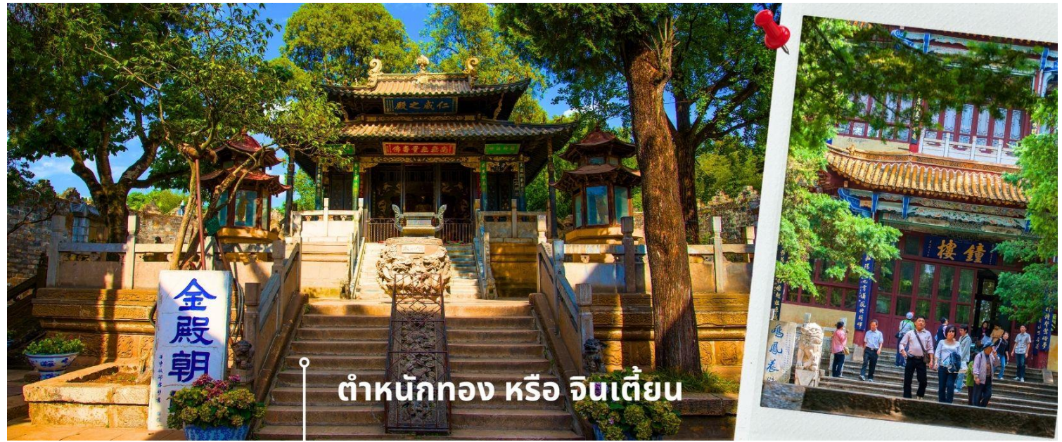
ดำหนังกอง หรือ จินเตี้ยน

Day 2 ดำหนังกอง (ไม่รวมค่ารถแบดเตอร์ 10 หยวน/ท่าน)-สวนน้ำตกคุนหมิง-ออกเดินทางสู่เมืองต้าหลี่ 00.15 เดินทางถึง สนามบินเมืองคุนหมิง ประเทศจีน หลังจากนั้นนำท่านผ่านด่านตรวจคนเข้าเมือง รับกระเป๋าสัมภาระ หลังจากนั้นเดินทางเข้าโรงแรมที่พัก (เวลาที่ประเทศจีนเร็วกว่าประเทศไทย 1 ชั่วโมง) 🇨🇳 เดินทางเข้าที่พัก WANJINAN HOTEL ระดับ 4 ดาวห้องถิ่นหรือเทียบเท่า 🍽️ รับประทานอาหารเช้า ณ ห้องอาหารโรงแรม (1) เช้า นำท่านเยี่ยมชม ดำหนังกอง หรือ จินเตี้ยน (The Golden Temple Park | Jindian park) (ไม่รวมค่ารถแบดเตอร์ 10 หยวน/ท่าน) โบราณสถานสำคัญของมณฑลยูนนาน ที่ได้รับการปกป้องดูแลโดยรัฐบาลจีน ตั้งอยู่บริเวณเชิงเขาหมิงเฟิง ล้อมรอบด้วยแนวกำแพงและหอคอยเหมือนเป็นป้อมปราการ ดำหนังกองถูกเรียกตามลักษณะอาคารที่มีสีทอง