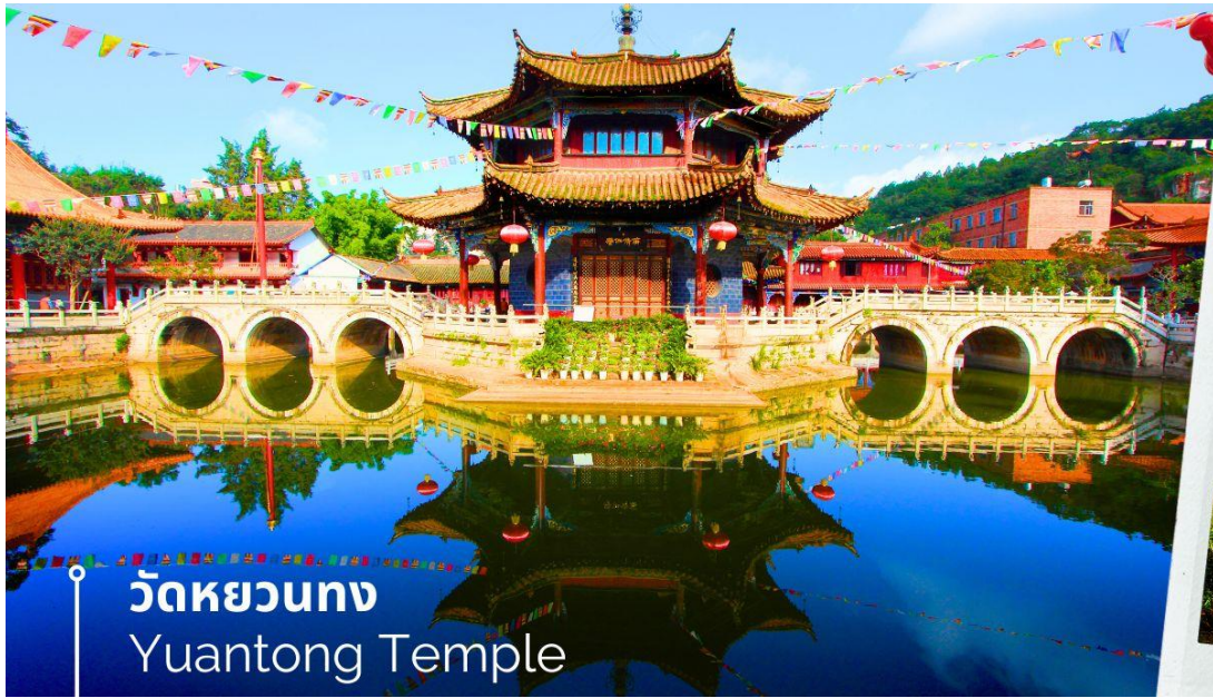
วัดหยวนตง Yuantong Temple

นำท่านชม วัดหยวนตง (Yuantong Temple) วัดแห่งนี้เป็นวัดที่ใหญ่และเก่าแก่ที่สุดในเมืองคุนหมิง สร้างมาตั้งแต่สมัยราชวงศ์ถัง มีอายุยาวนานประมาณ 1,200 กว่าปี การสร้างวัดแห่งนี้จะแปลกตากว่าวัดอื่นในจีน เพราะปกติแล้วการสร้างวัดของจีนส่วนมากจะต้องสร้างอยู่บนภูเขา แต่วัดหยวนตงสร้างวัดต่ำกว่าภูเขา โดยวิหารจะอยู่ต่ำที่สุดเนื่องจากวัดแห่งนี้ไม่ได้สร้างขึ้นเพื่อเป็นวัดโดยตรง แต่เคยเป็นศาลเจ้าแม่กวนอิมมาก่อน