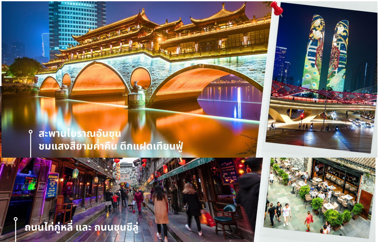
สะพานโบราณอันซุน ชมแสงสียามค่ำคืน ตึกแฝดเทียนฟู

ชมสะพานโบราณอันซุน-พร้อมชมแสงสียามค่ำคืน ตึกแฝดเทียนฟู เป็นสะพานข้ามคลองที่สร้างเป็นเหมือนอาคารอยู่ข้างบน ในช่วงเวลายามเย็นจะเป็นช่วงที่ผู้คนออกมาชมบรรยากาศบริเวณของสะพานแห่งนี้ และมีร้านค้ามากมาย รวมไปถึงบาร์เครื่องดื่มต่างๆ ที่ดึงดูดนักท่องเที่ยวได้เป็นอย่างดี เป็นสะพานที่ทอดข้ามแม่น้ำจินเจียง และเป็นรูปแบบสะพานมีหลังคา ตามลักษณะสถาปัตยกรรมจีนโบราณ อายุมากกว่า 300 ปี และในบริเวณใกล้เคียงกัน ยังเป็นที่ตั้งของ ตึกแฝด