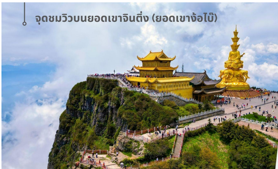
จุดชมวิวยบนยอดเขาจินตัง (ยอดเขาจ้อไบ๊)

หลังอาหารเช้าท่านเดินทางสู่เขาจ้อไบ๊ นำท่านเปลี่ยนเป็นรถท้องถิ่นขึ้นภูเขาแล้วนั่งกระเช้าลอยฟ้าขึ้นสู่ จุดชมวิวยบนยอดเขาจินตัง (ยอดเขาจ้อไบ๊) (รวมกระเช้า+รถอุทยานฯ) ที่มีความสูงจากระดับน้ำทะเล 3,077 เมตร ท่านจะได้เห็น