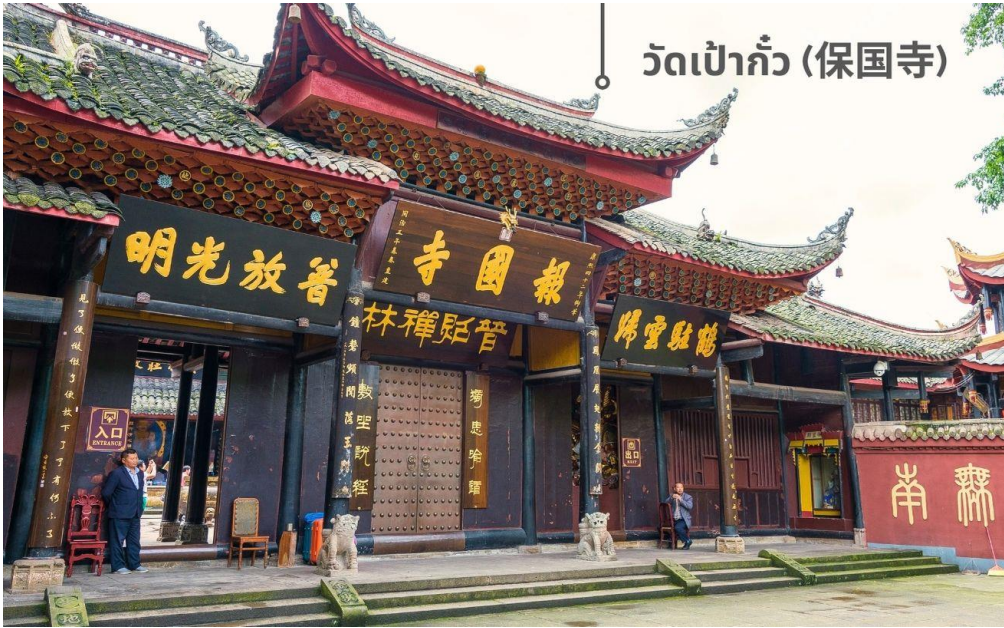
วัดเป้ากั๋ว (保国寺)