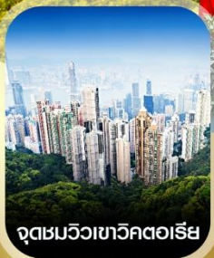
จุดชมวิวกาวิคตอเรีย