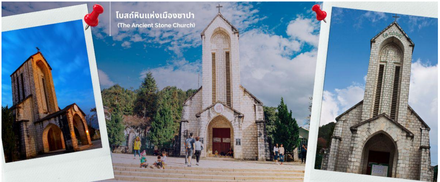
โบสถ์หินแห่งเมืองซาปา (The Ancient Stone Church)

จากนั้นพาทุกท่านชม โบสถ์หินแห่งเมืองซาปา (The Ancient Stone Church) อีกหนึ่งแลนด์มาร์กสำคัญของซาปาที่ต้องไปเช็คอิน เป็นโบสถ์หินที่สร้างขึ้นโดยชาวฝรั่งเศส เนื่องจากครั้งที่เป็นเมืองอาณานิคม มีชาวฝรั่งเศสมาอาศัยอยู่เมืองซาปาจำนวนมาก จึงเป็นโบสถ์สำคัญของเมืองนี้ที่ใช้ในการร่วมพิธีมิสซา ถึงแม้ว่าในตอนนี้อาณานิคมจะย้ายกลับไปแล้ว แต่โบสถ์แห่งนี้ก็ได้รับการอนุรักษ์เอาไว้เป็นอย่างดีและชาวซาปาที่เป็นคาทอลิกก็ยังคงใช้งานอยู่จนปัจจุบัน นำท่านช้อปปิ้งที่ ตลาดไนต์เมืองซาปา มีสินค้าให้ท่านเลือกช้อปปิ้งมากมาย ไม่ว่าจะเป็นสินค้าพื้นเมือง ของฝาก ขนม กระเป๋า รองเท้า ท่านสามารถช้อปปิ้งได้อย่างจุใจ