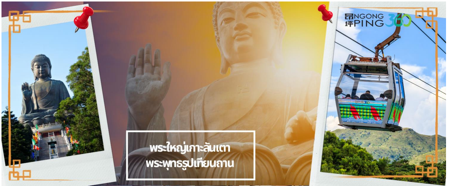
พระใหญ่เกาะลันเตา พระพุทธรูปเทียนถาน

ร้านค้าคาเฟ่ในหมู่บ้านนองปิง หรือบางท่านอาจจะเลือกซื้อของขวัญของที่ระลึกจากหมู่บ้านนองปิง อาทิเช่น หยกไข่มุก หรือเครื่องประดับคริสตัล เพื่อเป็นของที่ระลึก จากนั้นนั่งกระเช้ากลับลงมายังสถานี Tung Chung จากนั้นนำท่านช้อปปิ้งที่ ซิตี เกท เอาท์เล็ต (CITY GATE OUTLET) เป็นเอาท์เล็ตขนาดใหญ่ที่สุดของฮ่องกง อยู่ใกล้กับสนามบินฮ่องกง ติดกับสถานีรถไฟ TUNG CHUNG STATION ซึ่งมีสินค้าแบรนด์เนมระดับโลกมากมาย เป็นที่นิยมของนักท่องเที่ยวหรือแม้กระทั่งคนท้องถิ่นเอง ก็มาช้อปปิ้งกันที่นี่ นอกจากส่วนของห้างแล้วยังมีร้านอาหารต่างๆ, ศูนย์อาหาร FOOD REPUBLIC, ซูเปอร์มาร์เก็ต, โรงภาพยนตร์ และโรงแรม NOVOTEL CITY GATE HONG KONG ห้าง CITY GATE OUTLET มีแบรนด์ต่างๆให้เลือกมากกว่า 90 แบรนด์ เช่น NIKE, ADDIDAS, NEW BALANCE, BURBERRY, COACH, MICHEL KOR, KATE SPADE, POLO RALPH LAUREN, THE NORTHFACE, ARMANI