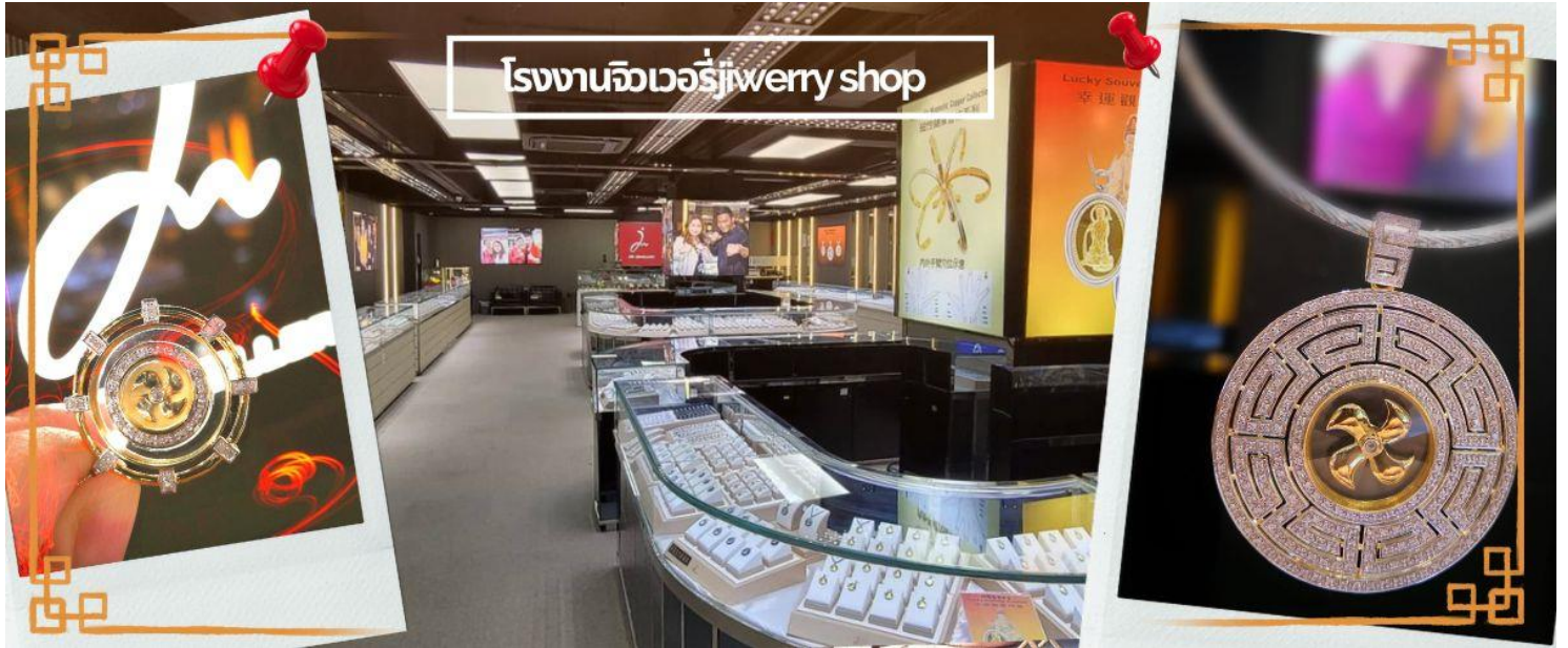
โรงงานจิวเวลรี่ jewelry shop

จากนั้นนำท่านเดินทางสู่ วัดแชกง ที่ซาถิ้น (CHE KUNG TEMPLE AT SHA TIN) วัดแชกงสร้างขึ้นเพื่อเป็นอนุสรณ์เพื่อรำลึกถึงตำนานแห่งนักรบราชวงศ์ซ่ง มีนามว่า “แช กง” แม่ทัพปราบศึก ผู้คนทั่วทุกดินแดนต่างยำเกรงในกำลังพลอันกล้าหาญแข็งแกร่งของแม่ทัพแชกง ตั้งอยู่ในเขต SHATIN มีประวัติเล่าต่อกันมาว่า ขณะที่แม่ทัพปราบศึกอยู่นั้น ทุกแคว้นเขตแดนแผ่นดินใหญ่ต่างก็ยำเกรงต่อกำลังพลที่กล้าหาญในกองทัพของท่าน ยามที่ออกรบเพื่อดำเนินเข้าศึกศัตรูทุกทิศทาง ทุก ๆ ครั้ง ท่านใช้สัญลักษณ์รูปกังหัน 4 ใบพัดติดไว้ด้านหลังรถศึกนำขบวนในกองทัพ เหล่าทหารกล้ามีความเชื่อว่าเมื่อพกพาสัญลักษณ์รูปกังหันนี้ไป ณ ที่ใด ๆ กังหันนี้จะช่วยเสริมสิริมงคล นำพาแต่ความโชคดี