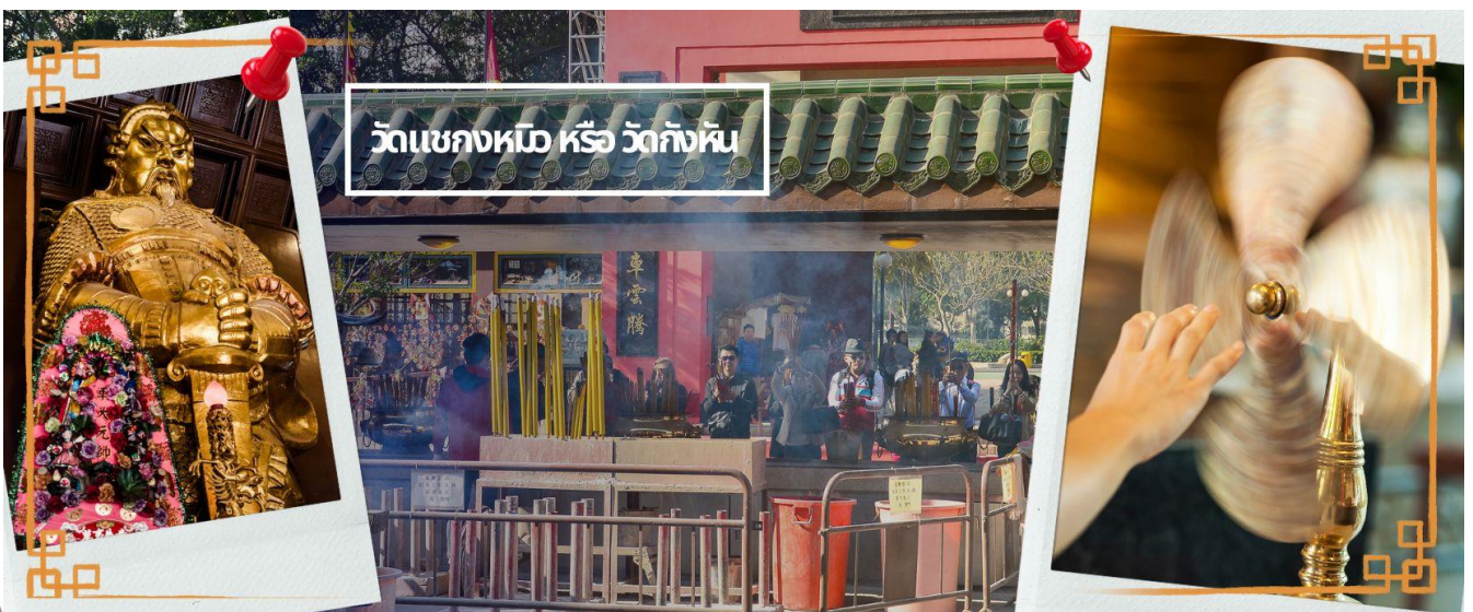
วัดแชกงหมือ หรือ วัดกังหัน

มีอำนาจเข้มแข็ง เสริมกำลังใจให้แก่กองทัพของท่าน ชื่อเสียงในการนำทัพสู้ศึกของท่านจึงเป็นตำนานมาจนทุกวันนี้ ปัจจุบันวัดแชกง จึงเป็นสถานที่สักการะเคารพ ขอพร ท่านแชกง โดยมีสัญลักษณ์เป็นกังหันนำโชค การหมุนกังหันนำโชคที่ตั้งอยู่ในวัด เพื่อจะได้หมุนเวียนชีวิตของเราและครอบครัวให้มีความเจริญก้าวหน้าด้านหน้าที่การงาน