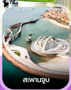
สะพานจูป

✈️ คอนเฟิร์ม ออกเดินทาง ทุกพีเรียด 2 ท่านขึ้นไป ✈️