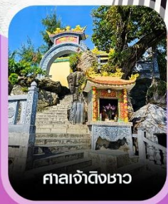
ศาลเจ้าดิ้งขาว