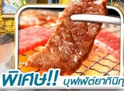
พิเศษ!! บุฟเฟ่ต์ย่างกิงกุ