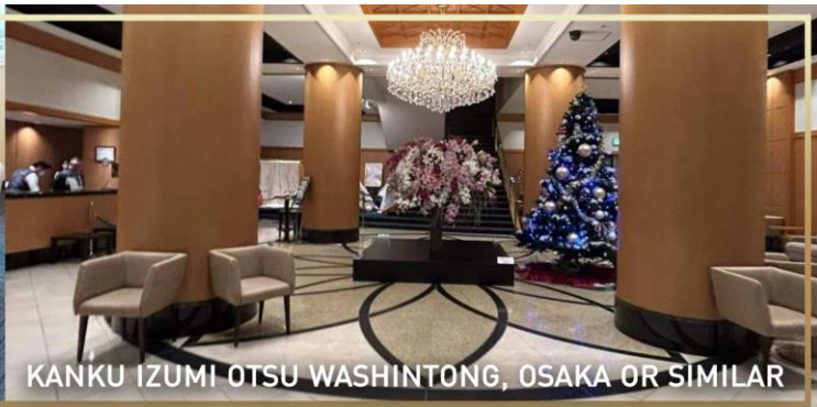
KANKU IZUMI OTSU WASHINTONG, OSAKA OR SIMILAR

วันที่ 2 ปราสาทฮิเมจิ – โรงกลั่นสาเก NADAGIKU - โกเบ พอร์ต ทาวเวอร์ – ย่านชินเซไก