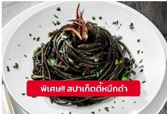
พิเศษ!! สปาเก็ตตี้หมึกดำ

เที่ยง 🍴 รับประทานอาหารเที่ยง (มื้อที่9) เมนูพิเศษ!! สปาเก็ตตี้หมึกดำ