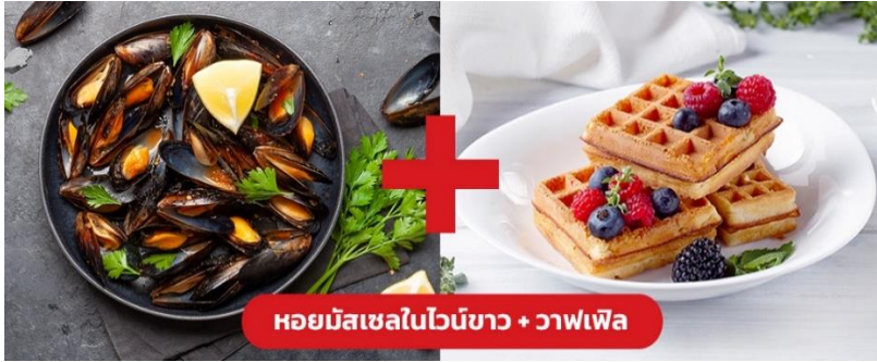
หอยมัสเซลในไวน์ขาว + วาฟเฟิล

Highlight! หอยมัสเซลอบมาในซอสไวน์ขาวสุดกลมกล่อมผสานกับความหวานของหอย เสิร์ฟพร้อมคู่กับเบลเยียม วาฟเฟิล (Belgain Waffle) เป็นเมนูตัดเลี่ยนที่ทานแล้วลงตัวสุดๆ 😊