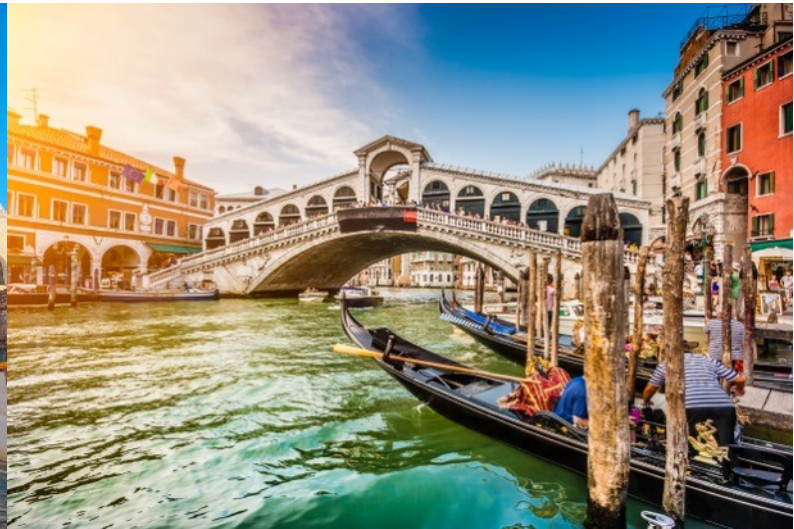
อริยาศัย

เที่ยง 🍴 รับประทานอาหารกลางวัน (มื้อที่3) เมนูพิเศษ!! สปาเก็ตตี้หมึกดำ