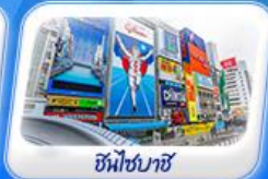
ชินไซบาชิ