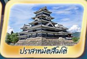
ปราสาทมัตสึโมตี