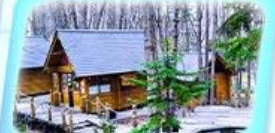
นิงเกิลทอมโอะ