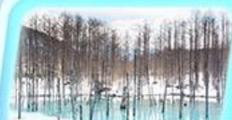
ปอน้ำสีฟ้า