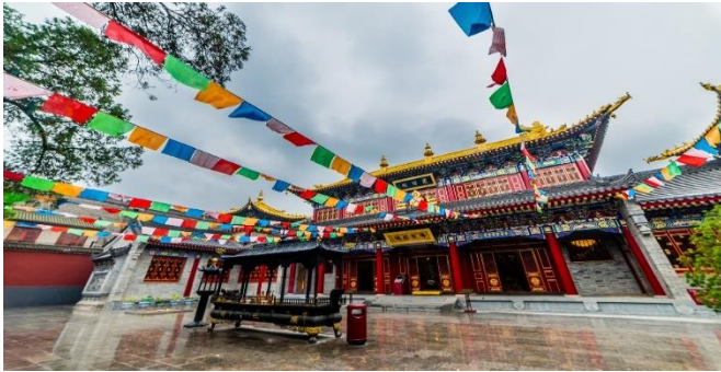
พาท่านชม วัดลามะกว้างเหริน (Guangren Temple)

(ระยะทางประมาณ 5 กิโลเมตร ใช้เวลาเดินทางประมาณ 10-15 นาที)