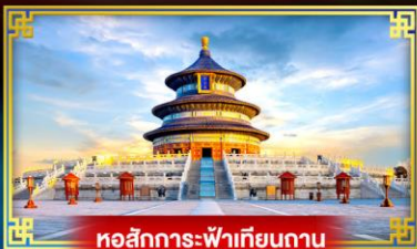
หอสักการะฟ้าเทียนถาน