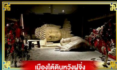
เมืองใต้ดินหวังฟูจิ่ง