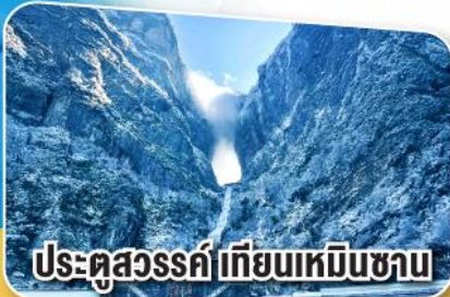
ประตูสวรรค์เทียนเหมินซาน