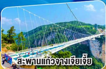
สะพานแกว่งจางเจียเจีย