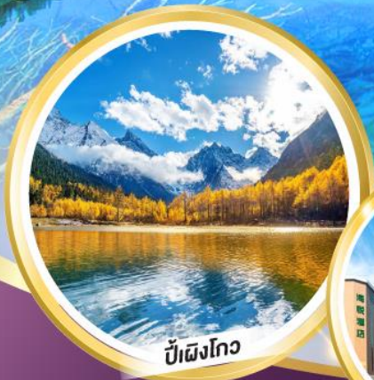
ปี้ผิงโกว