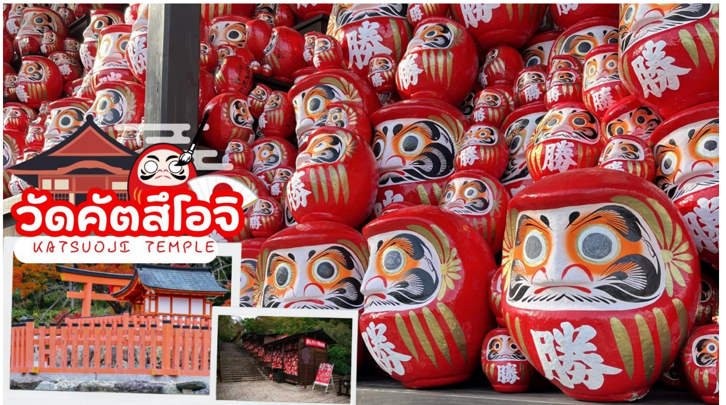
วัดคัตสึโอจิ KATSUOJI TEMPLE

07.30 น. เดินทางถึง สนามบินคันไซ ประเทศญี่ปุ่น (เวลาท้องถิ่นเร็วกว่าเวลาประเทศไทย 2 ชม.) ผ่านขั้นตอนการตรวจคนเข้าเมือง ด้านศุลกากร และรับกระเป๋าเรียบร้อยแล้ว [สำคัญมาก!!ไม่อนุญาตให้นำอาหารสด จำพวก เนื้อสัตว์ พืช ผัก ผลไม้ เข้าประเทศญี่ปุ่นหากฝ่าฝืนมีโทษจับปรับได้]