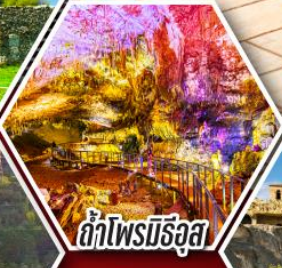
ลำโพรมิธิอัส