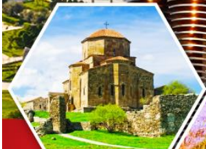
วิหารจอร์