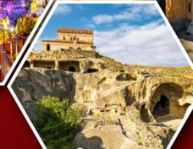
เมืองดำอพิลิสตีเคห์