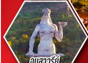
อนุสาวรีย์ มารดาแห่งจอร์เจีย