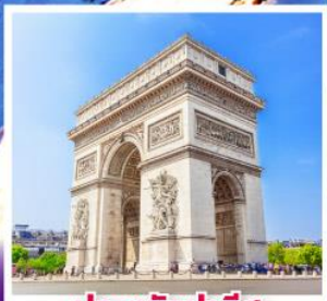
ประตูชัยปารีส