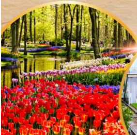
เทศกาลดอกไม้ เคอเคนฮอฟ