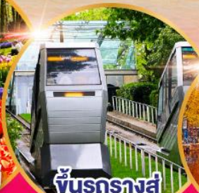
ขึ้นรถไฟสู่ ย่านมงมาร์ต