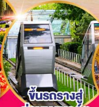
ชั้นรางสู่ ย่านมงมาร์ต