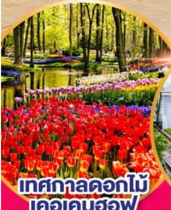
เทศกาลดอกไม้ เคอเคนฮอฟ