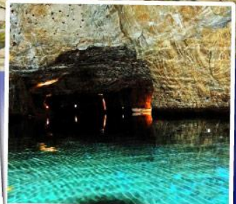
ทะเลสาบใต้ดินเซนต์เลียวนาร์ด

ล่องเรือชมทะเลสาบใต้ดินเซนต์เลียวนาร์ด ทะเลสาบใต้ดินลึกลับ สุด Unseen แห่ง สวิตเซอร์แลนด์