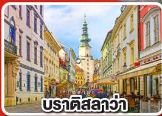
ปราติสลาวา

เที่ยวเมือง คาร์โลวารี เมืองแห่งสปา พร้อมเมนูพิเศษปิดโบฮีเมีย