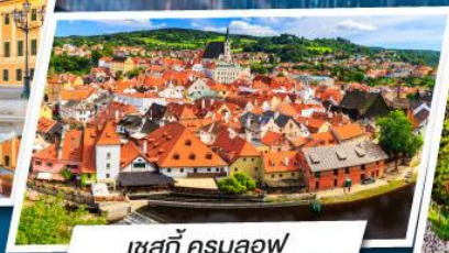
เชสกี คุรมลอฟ