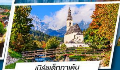
เบิร์ชเต็กกาเดิน