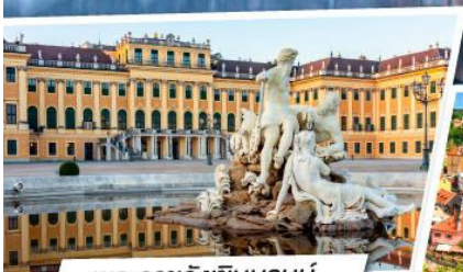
พระราชวังเซินบรุนน์