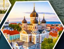
วิหารอเล็กซานเดอร์ เนฟสกี (ทาลลินน์)