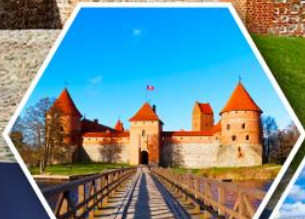
ปราสาททราไค