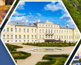
พระราชวังรินดาเล