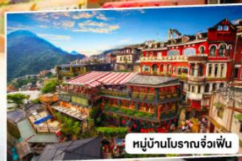
หมู่บ้านโบราณจั๋วเฟิ่น