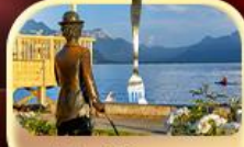
ซาลี แชลป์ลิน THE FORK