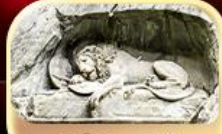
สิงโตหินแกะสลัก