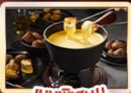
เมนูพิเศษ!! สวิสฟองดู

เบิร์น เวอว์ย เซอร์แมท อินเทอร์ลาเกน ทิตลิส ลูเซิร์น ซูริค