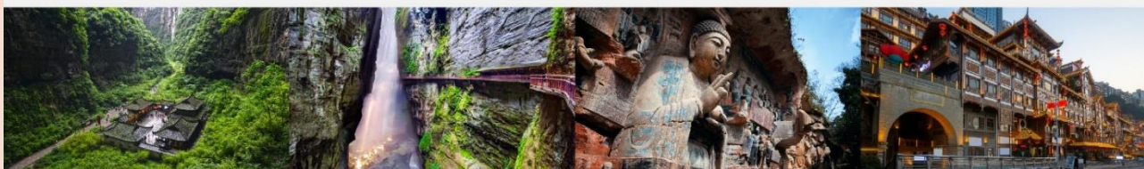
อุทยานแห่งชาติหลุมฟ้า 3 สะพานสวรรค์