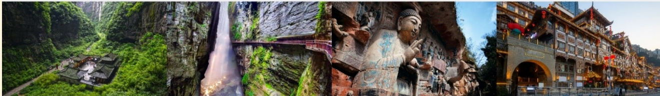
อุทยานแห่งชาติหลุมฟ้า 3 สะพานสวรรค์