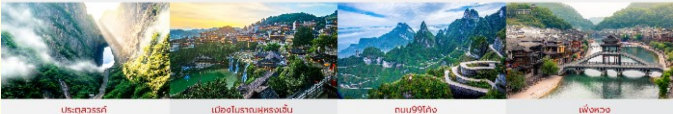
ประตูสวรรค์ เมืองโบราณฝูหรงเจิน ถนน99โค้ง เฟิ่งหวง *ทางบริษัทฯ ขอสงวนสิทธิ์ในการสลับโปรแกรมทัวร์ตามความเหมาะสมขึ้นอยู่กับสถานการณ์ปัจจุบัน โดยคำนึงถึงผลประโยชน์ของลูกค้าเป็นสำคัญ