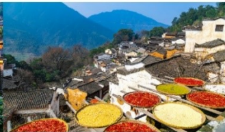
หมู่บ้านหวงหลิง