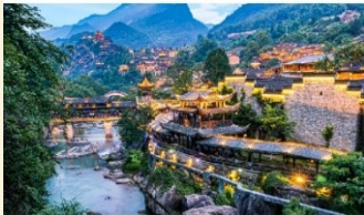
หุบเขาเทวดาฉางเซียงนู่