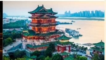
หอแดงหวัง

*ทางบริษัทฯ ขอสงวนสิทธิ์ในการสลับโปรแกรมทัวร์ตามความเหมาะสมขึ้นอยู่กับสถานการณ์หน้างาน โดยคำนึงถึงผลประโยชน์ของลูกค้าเป็นสำคัญ