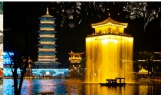
ล่องเรืออู๋หนี่โจว