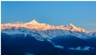
กูเขาหิมะเหมยลี่