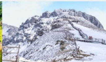
กุเขาคิมะสื่อซ่า