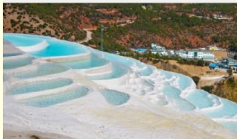
ระเบียงธารน้ำขาว "ไป๋สุ่ยโต"