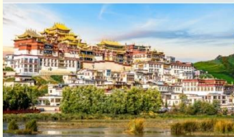
วัดลามะชงจันหลิน