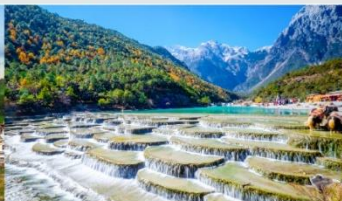
ทะเลสาบไป๋ส่วยเหอ