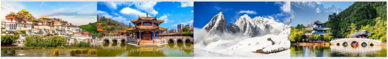
วัดลามะชงจันหลิน