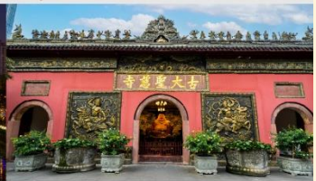
วัดต้าจื่อ

*ทางบริษัทฯ ขอสงวนสิทธิ์ในการสลับโปรแกรมทัวร์ตามความเหมาะสมขึ้นอยู่กับสถานการณ์หน้างาน โดยคำนึงถึงผลประโยชน์ของลูกค้าเป็นสำคัญ