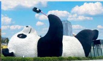
รูปปั้นหมีแพนด้าอนเซลฟี่