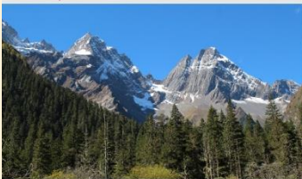
ภูเขาสี่ดรุณี (หุบเขาชวงเจียวโกว)