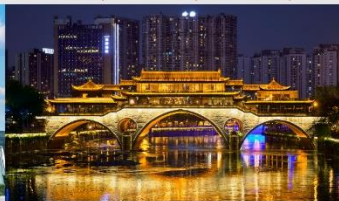
สะพานอันซุน