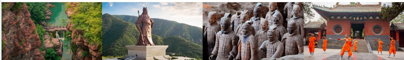
อุทยานสวรรค์หยุนโถซาน