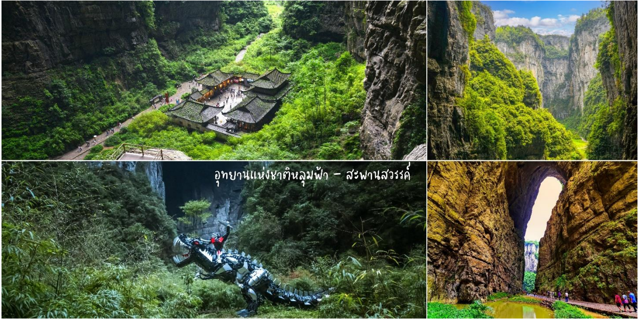
อุทยานแห่งชาติหลุมฟ้า - สะพานสวรรค์

TRANSFORMER4 ที่โด่งดังไปทั่วโลก นำท่านสัมผัส สะพานแก้วสวรรค์ หรือระเบียงกระจกชมวิว ออกแบบโดยผู้เชี่ยวชาญทั้งในและนอกจีน ตั้งอยู่ 11 เมตรเหนือขอบหน้าผาสูงในเมืองเซียนหนู่ชาน กว้างอีก 26 เมตร