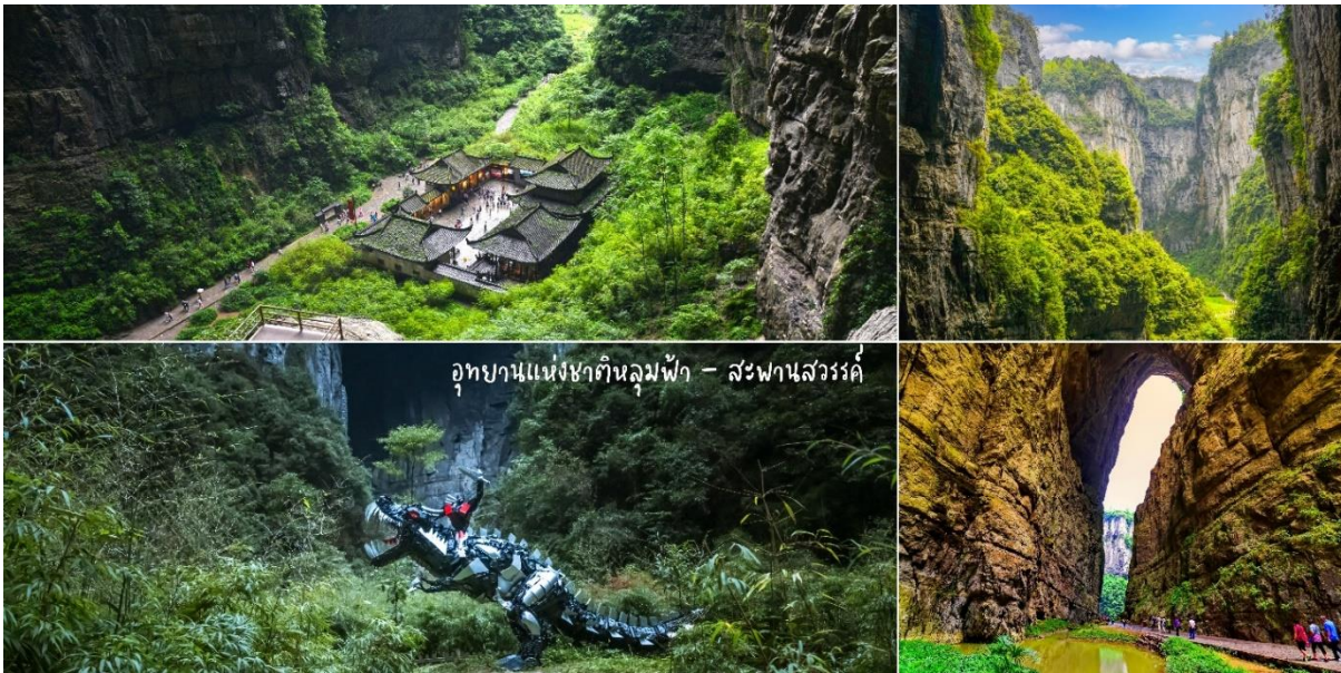
อุทยานแห่งชาติหลุมฟ้า - สะพานสวรรค์

หลังจากนั้นนำท่านโดยสารลิฟท์แก้ว ลงไปสู่หุบเหวเบื้องล่างที่ระดับความลึกประมาณ 80 เมตร เมื่อลงไปถึงแล้วจะพบกับเส้นทางเดินเท้าที่ชมความมหัศจรรย์ทางธรรมชาติของกลุ่มสะพานสวรรค์ (กลุ่มสะพานหินธรรมชาติที่ใหญ่ที่สุดในเอเชีย) ซึ่งประกอบด้วย 3 สะพาน แห่งแรกคือสะพานมังกรสวรรค์ ลักษณะเป็นโพรงขนาดใหญ่ เมื่อมองทะลุออกไปคล้ายกับสะพานเชื่อมสวรรค์กับโลกมนุษย์ สะพานแห่งที่สองคือ สะพานมังกรเขียว ลักษณะเป็นหน้าผาที่มโหฬารไปเ็นท้องฟ้า และสะพานแห่งที่สามคือ สะพานมังกรดำ ลักษณะเป็นโตรกหน้าผาอยู่ในส่วนที่แคบที่สุด แสงผ่านเข้าไปน้อย ทำให้ดูค่อนข้างมืดดำ ภายในอุทยานแห่งชาติหลุมฟ้า-สะพานสวรรค์ ยังมีโรงเตี๊ยมเก่าๆ ซึ่งเป็นจุดแวะพักของคนเดินทางในสมัยก่อนตั้งแต่ในสมัยราชวงศ์ถัง (ค.ศ. 618-907) และจุดนี้เองที่จางอี้หมอใช้เป็นฉากในหนังการถ่ายทำหนังเรื่อง “ศึกโค่นบัลลังก์วังทอง”